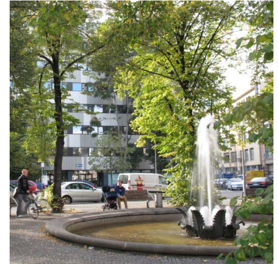
Professional School of Education Hausvogteiplatz 5-7, 10117 Berlin